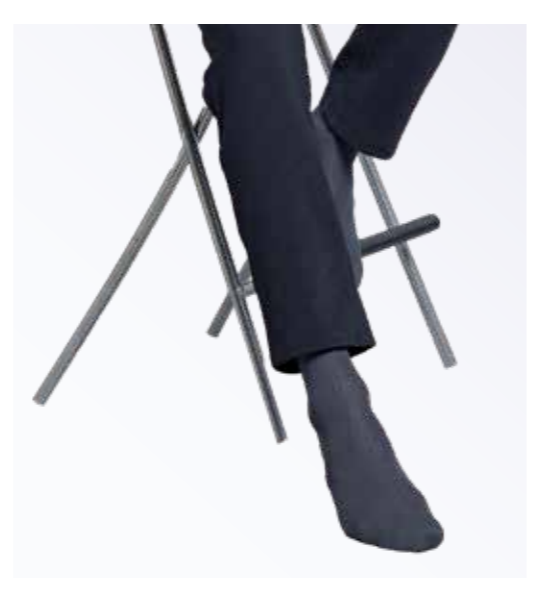
LS003 紳士乾爽襪 - 灰色，24-26 cm