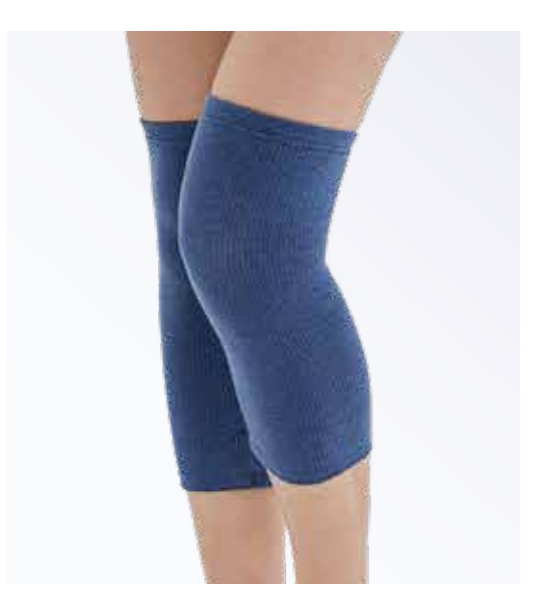
SA907 護膝 (NI50限定) - 牛仔藍，Free Size