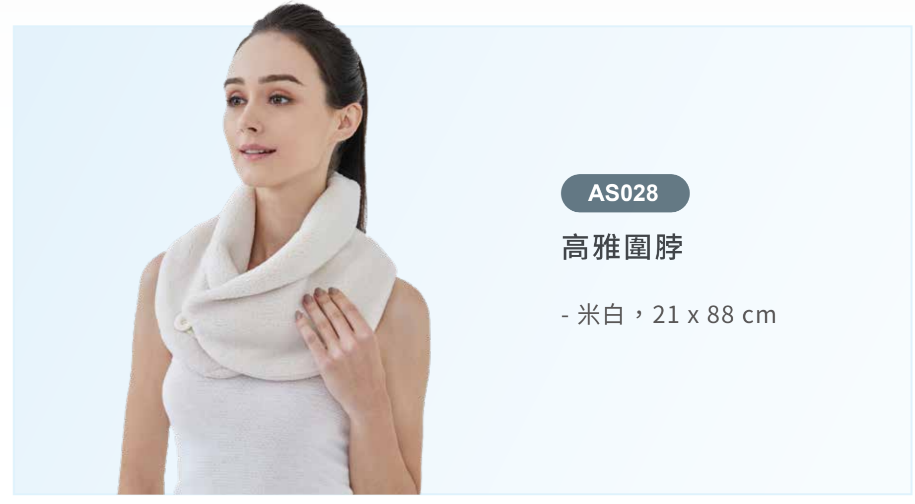
AS028 高雅圍脖 - 米白，21 x 88 cm