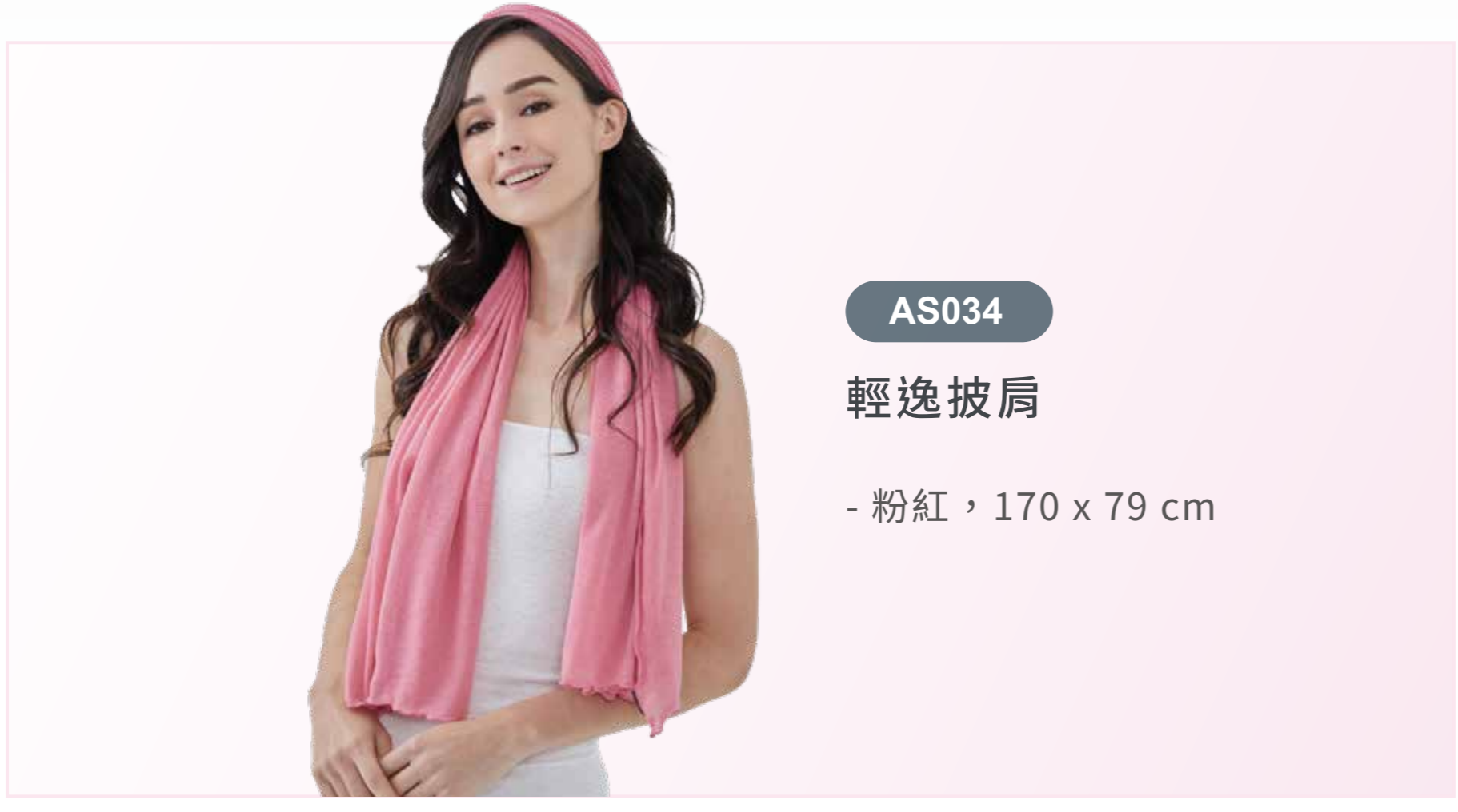
AS034 輕逸披肩 - 粉紅，170 x 79 cm